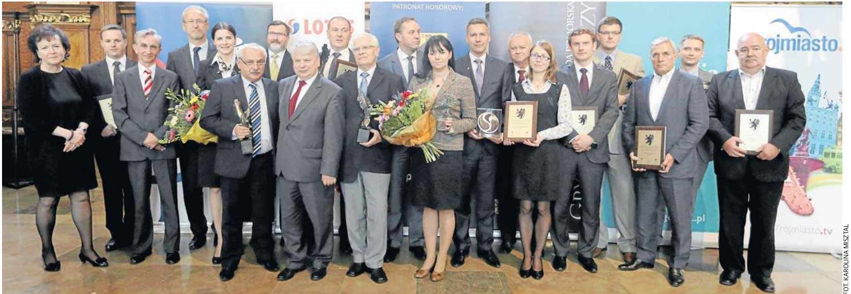
Laureaci ubiegłorocznej edycji Nagrody Pomorskiej Gryf Gospodarczy podczas gali w Dworze Artusa

Celem konkursu jest promocja przedsiębiorczości i aktywności gospodarczej przedsiębiorstw województwa pomorskiego poprzez: prezentację i promowanie firm, które mają korzystny wpływ na rozwój gospodarczy województwa, upowszechnianie dobrych praktyk w biznesie, promowanie korzystnego i pożądanego wizerunku gospodarczego, promowanie laureatów konkursu poprzez ich rekomendacje do ogólnopolskich nagród i wyróżnień, włączenie sektora przedsiębiorców do szerokiej współpracy z jednostkami samorządu terytorialnego, inicjowanie pozytywnego współzawodnictwa przedsiębiorstw.